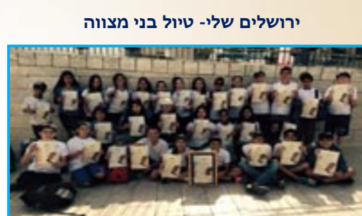
ירושלים שלי- טיול בני מצווה