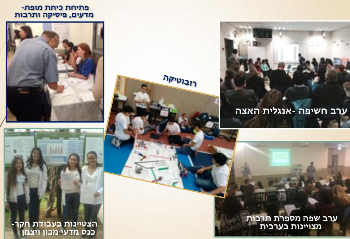
הצטיינות בעבודת חקר- כנס מדעי מכון ויצמן