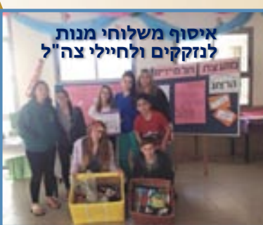
איסוף משלוחי מנות לנזקקים ולחילי צה"ל