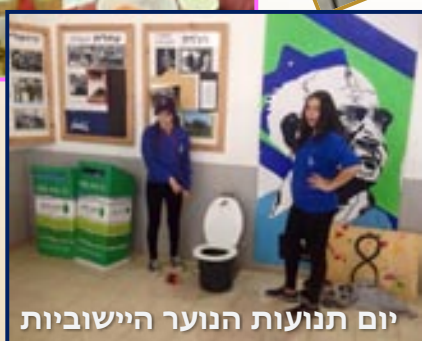
יום תנועות הנוער היישוביות