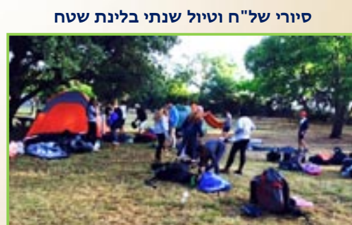
סיורי של"ח טיול שנתי בלינת שטח