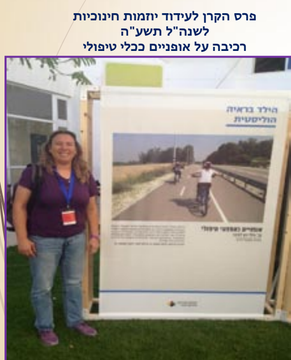
פרס הקרן לעידוד יחמות חינוכיות לשנה"ל תשע"ה רכיבה על אופניים ככלי טיפולי